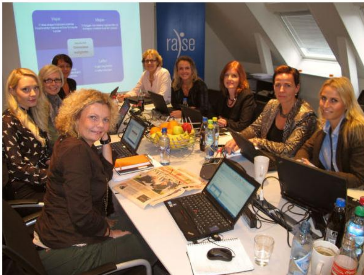
KVINNER PÅ TOPPEN: Ledergruppen i Raise Gruppen, består av ti kvinner - og ingen menn. De tror ikke noe på at kvinnedominerte miljø er mer preget av konflikter.