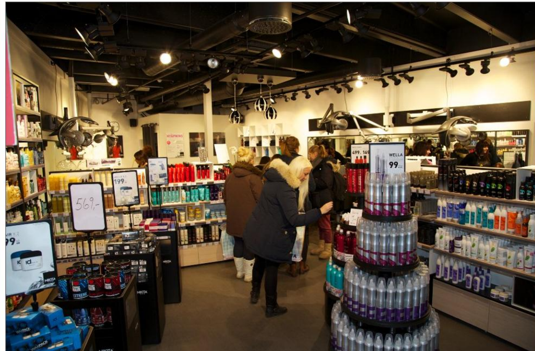
NYTT: Alt er nytt i den nye delen på Sogningen storsenter. Frisørkjeden Nikita føyer seg inn i rekkja med nyetableringar i Sogndal denne hausten.